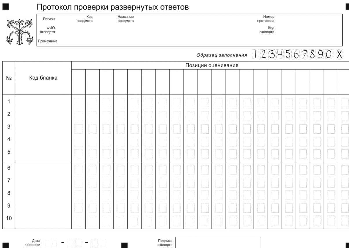
Рис. 1. Протокол проверки развернутых ответов

Верхняя часть протокола заполняется автоматизированно (рис. 2). В левой части протокола автоматизированно заполнены коды бланков работ, которые были назначены эксперту.